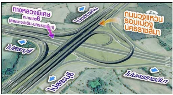
ทางแยกต่างระดับ