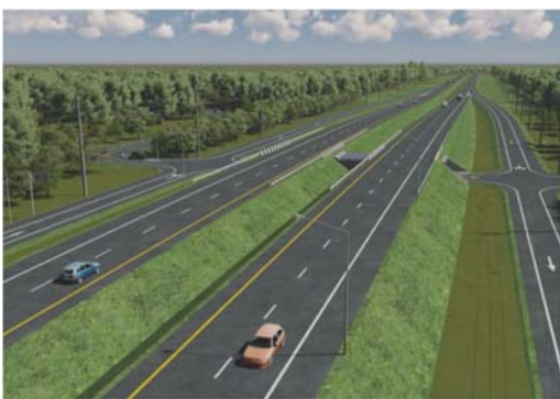
ทางลอดบริเวณจุดตัดทางหลวงชนบท นม.3518