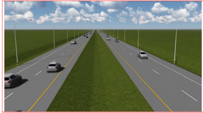
รูปแบบทั่วไปของ